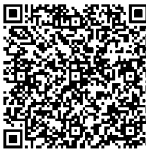
Рисунок 7 — Сценарий тематической викторины с примерами вопросов

В каждом из перечисленных мероприятий важно отслеживать активность участников, высказываемыми ими мнения, их настрой в целом. На таких мероприятиях необходимо присутствие психолога для фиксации активности и оценки их поведения.