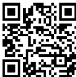
Рисунок 6 — Рекомендации по проведению кинопоказов в профилактике

Среди фильмов по тематике противодействия терроризму можно использовать следующие фильмы: «Беслан. Память» (Россия, 2014 г., возрастное ограничение: 12+), «Кавказский пленник» (Россия, 1996 г., возрастное ограничение: 18+), «Я не террорист» (Узбекистан, 2021 г., возрастное ограничение: 18+), «Отель Мумбаи: противостояние» (США, Австралия, 2018 г., возрастное ограничение: 18+) и т.д.