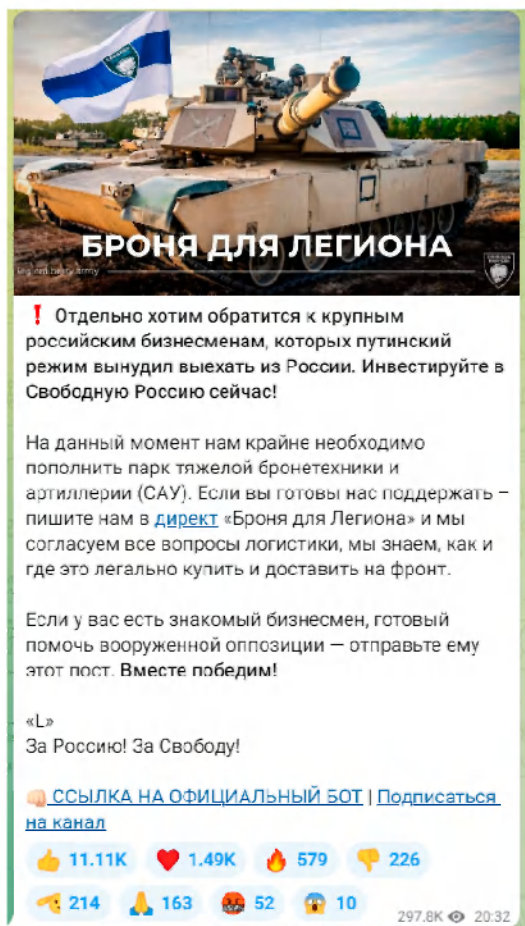
Рисунок 3 — Скриншот телеграм-канала легиона «Свобода России» с призывом к финансированию

Важно подчеркнуть, что помимо собственно пропаганды и распространения идеологии террористических организаций, а также вовлечения в деятельность террористических организаций существует еще одна угроза террористического характера — ложные сообщения о готовящемся террористическом акте. Только за 2021 год зафиксировано более 4,5 тысяч ложных сообщений о готовящихся терактах на объектах социальной инфраструктуры. Это может быть хулиганство, злой умысел, специфическое чувство юмора, желание проверить качество работы правоохранительных органов или антитеррористическую защищенность объекта и др. Во всех вышеперечисленных случаях за такой поступок придется нести уголовную ответственность. Ведь злоумышленник нарушает конструктивную деятельность общественных объектов, а правоохранителям приходится задействовать множество средств и сил, чтобы проверить объекты, которые якобы находятся под угрозой. За ложное сообщение о готовящемся теракте правонарушитель может быть наказан либо штрафами – от 200 тысяч рублей и до двух миллионов рублей, либо лишением свободы – от одного года до 10 лет. Ответственность за данный вид правонарушения наступает с 14 лет (статья 207 УК РФ «Заведомо ложное сообщение о акте терроризма»).