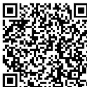
Рисунок 4 — Сценарий для проведения дебатов «Идеология радикализма»

Первая команда всегда будет представлять сторону радикальной идеологии. Задача команды студентов – найти контраргументы тех радикальных и спорных тезисов, которые будет озвучивать первая команда. Тем самым, участники будут вынуждены критически рассматривать постулаты радикальных идеологий, искать в них логические ошибки, несоответствия – самостоятельно приходиться к выводу о деструктивности любой радикальной идеологии (см. рисунок 4).