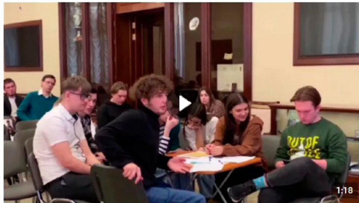
Дебаты «Идеология радикальных организаций» 1 888 просмотров

В рамках дебатов можно: развенчивать мифы, декларируемые представителями радикальных идеологий для вербовки; развивать навыки критического мышления и ведения дискуссии; формировать в целом антитеррористическое сознание и активную гражданскую позицию. Рекомендуется для мероприятия вовлекать не более 20 человек (см. рисунок 5).